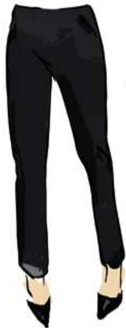
cigaretový strih v skrátenej dĺžke